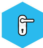
Tabla de plumb acopera atat blaturile usilor, cat si tocul acestora aplicat pe peretele cladirii.

Pentru ecranare/ protectie radiologica, se utilizeaza tabla de plumb cu grosimi variabile incepand de la 0,5-5 mm, in functie de: solicitarile clientului, calculul de radioprotectie efectuat de CNCAN si proiectul de executie.